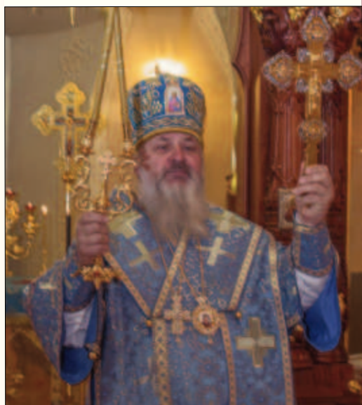
10 августа – день архиерейской хиротонии преосвященнейшего Тихона, епископа Видновского, игумена Екатеринбургского мужского монастыря

Братия и прихожане Екатеринбургского мужского монастыря сердечно поздравляют с праздничными датами преосвященнейшего владыку Тихона, игумена Серафима, игумена Пантелеимона с пожеланиями крепости душевных и телесных сил, помощи Божией в несении архипастырских и пастырских трудов на благо Святой Православной Церкви и народа Божия