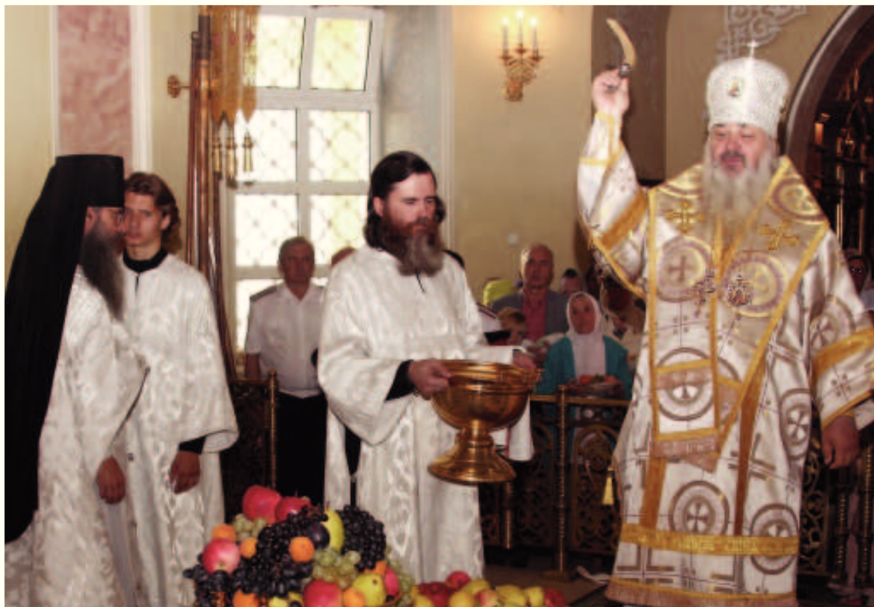
Освящение плодов в Екатерининском мужском монастыре 19 августа 2015 года. Яблочный Спас.