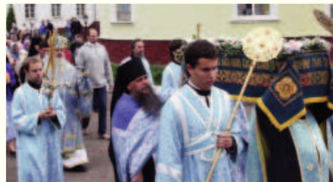
Чин погребения плащаницы Божией Матери в монастыре