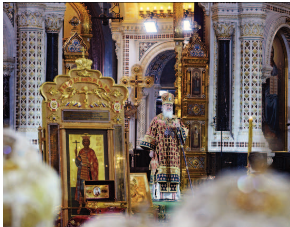
Праздничное богослужение в Кафедральном Соборном Храме Христа Спасителя, г. Москва

веком, отпустил на волю своих многочисленных жен и наложниц, отказался от злых дел, а народ любил его за доброту, милосер-