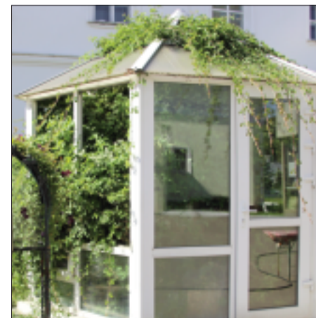
Куст Неопалимой Купины в Екатерининском монастыре, выращенный из росточка, привезённого с Синая.