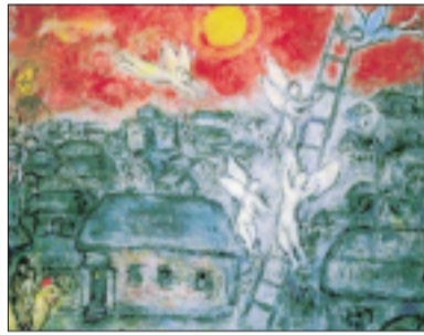
Лестница Иакова. Марк Шагал, 1973 г.