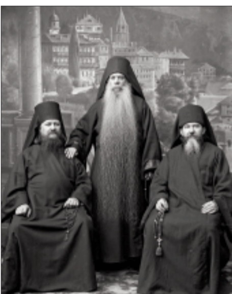
Русские монахи на Афоне

Один инок Григориатского монастыря во время бдения увидел, как с началом пения «Честнейшей» из алтаря вышла прекрасная Жена в игуменском одеянии и начала кадить церковь и молящихся.