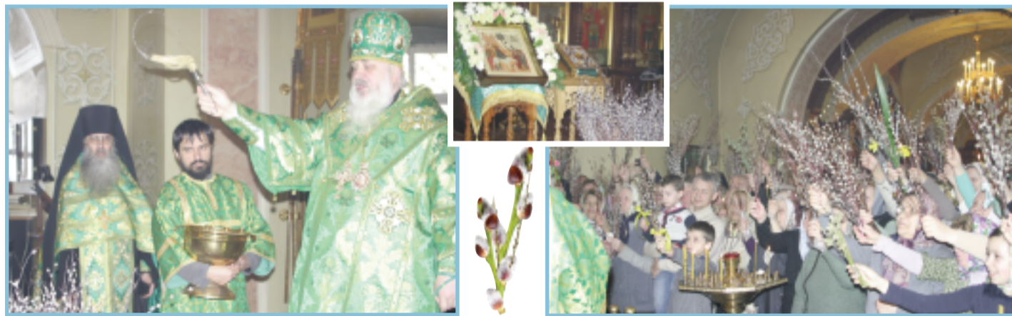
Праздник Вход Господень в Иерусалим. Освящение вербы в Екатеринбургском монастыре

чтв. – после Литургии молебен с акафистом святителю Николаю, Мирликийскому чудотворцу. ■