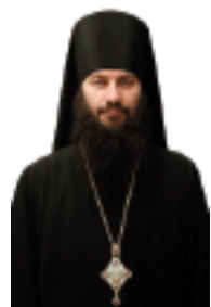
Епископ Орский и Гайский Иринея:

И напротив того, если для человека жизнь, поступки определяются верой, он не будет испытывать дискомфорта от поста.