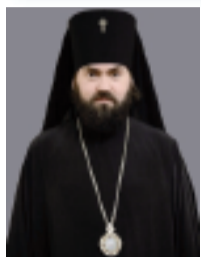
Архиепископ Пятигорский и Черкес- ский Феофилакт:

П одходит к концу лето. Для кого-то это пора отдыха (в разгаре летние отпуска), для кого-то – время страды (уборка урожая, заготовки на зиму), для школьников и их родителей – суетливая подготовка к новому учебному году. И как венец лета, приходит Успенский пост.