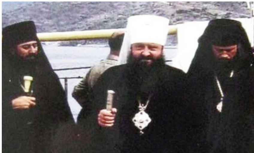
Митрополит Никодим (Ротов) на Святой Горе Афоне

Архимандриту Никодиму очень хотелось тогда попасть в русский монастырь. Местные власти, полиция, губернатор препятствовали ему, отговаривали, убеждали, что нельзя, опасно идти туда. Тогда владыка связался по