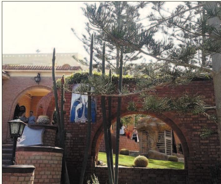
Современный вид монастыря св. вмч. Меркурия

Потом были улицы Каира, коридоры монастыря, тишина ночи. Игуменя пришла в себя стоящей посредине своей кельи. В руках у неё были бумаги. Промелькнула мысль, не заболела ли она лунатизмом. Но её душа ликовала, а сознание говорило, что случилось что-то невероятное, что-то весьма важное.